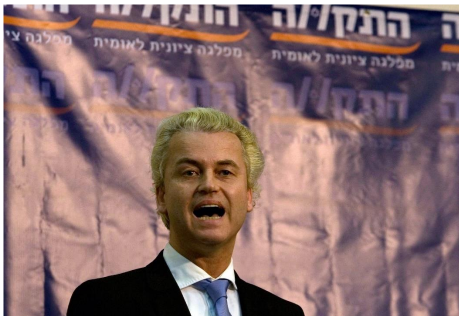
Geert Wilders spreekt

in Tel Aviv, 5 december 2010.