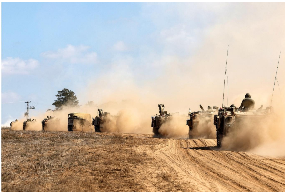
Israëlische tanks opgesteld bij de grens met de Gazastrook.

Op de zevende dag na zwarte zaterdag, de dag waarop honderden Hamasstrijders Israël infiltrerden en een massaslachting aanrichtten, zijn Israëliërs in diepe rouw. Iedereen heeft wel een familielid of vriend verloren, of kent een vermiste. Tijd voor reflectie is er niet want er zijn permanent raketaanvallen.