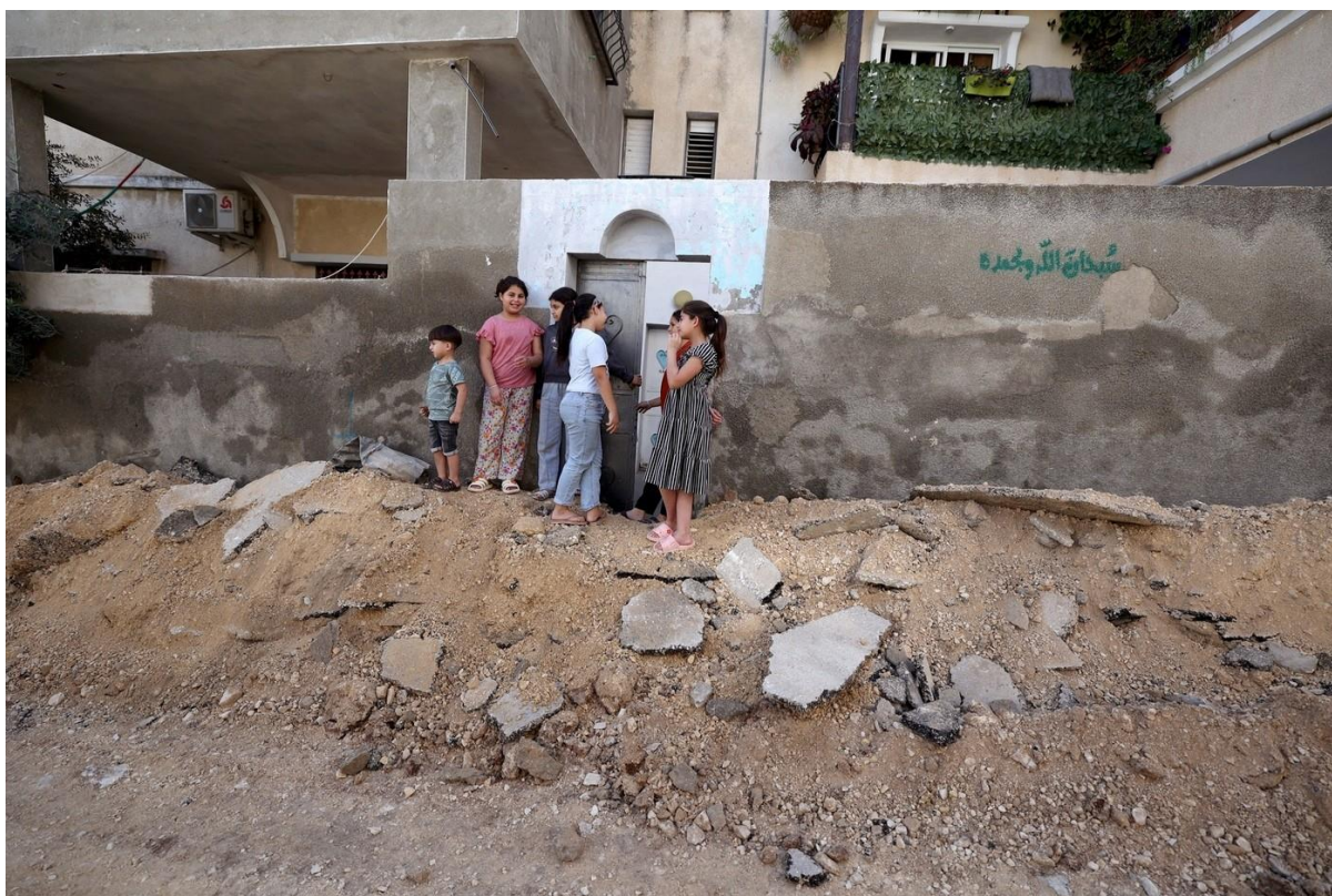
Kinderen staan bij een gebombardeerd gebouw in Jenin, op de Westelijke Jordaanoever, 3 november 2023

Twee maanden geleden hadden we een boeiende mailwisseling. Adania Shibli, de Palestijnse literatuurwetenschapper en auteur van de roman Een klein detail , schreef mij tijdens haar vlucht naar Malta en ik antwoordde vanachter mijn bureau in Israël. Zoekend en zorgvuldig formulerend beschreef zij haar roman, die het waargebeurde verhaal van de groepsverkrachting en moord op een Bedoeïenenmeisje in 1949 in de Negevwoestijn door een Israëlische legereenheid plaatst naast het fictieve verhaal van een Palestijnse vrouw uit Ramallah die op onderzoek gaat naar de toedracht van de moord. De roman die door J.W. Coetzee is beschreven als een verbazend, belangrijk boek wordt wel Shibli's literaire doorbraak genoemd en is in de Verenigde Staten genomineerd voor de National en International Book Awards. In Duitsland zou Shibli tijdens de Frankfurter Buchmesse de LiBeraturpreis ontvangen.