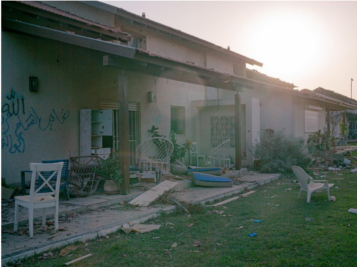
Kibboets Be'eri na de aanval van Hamas, 23 oktober